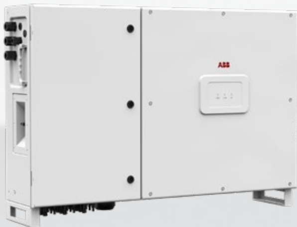
— Inversor de cadena PVS-50/60-TL

Esta nueva adición a la familia de inversores de cadena PVS, con 3 MPPT independientes y una potencia de hasta 60 kW, se ha diseñado para maximizar el retorno de la inversión en sistemas extensos, con todas las ventajas de las configuraciones descentralizadas, tanto en instalaciones montadas en suelo como en cubierta.